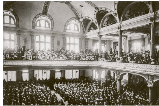
© Stadtarchiv Heidelberg, Bildsammlung, Signatur, BILDA 7487

The publication traces over a century of history of the architectural landmark at the foot of the Neckar